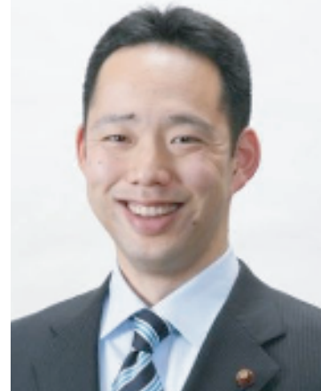
横浜市議員 2期目 よろしくお願いします！